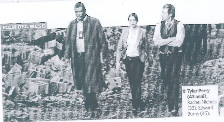
↑ Tyler Perry (43 anni), Rachel Nichols (33), Edward Burns (45).